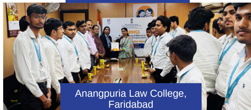
Anangpuria Law College, Faridabad