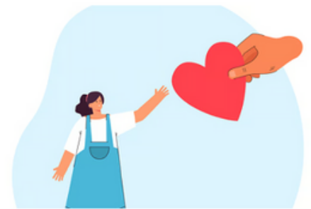
Image used for representational purpose.

In 2024-25, 328 children with special needs were adopted, including a child listed in the "other gender" category, a first since 2014.