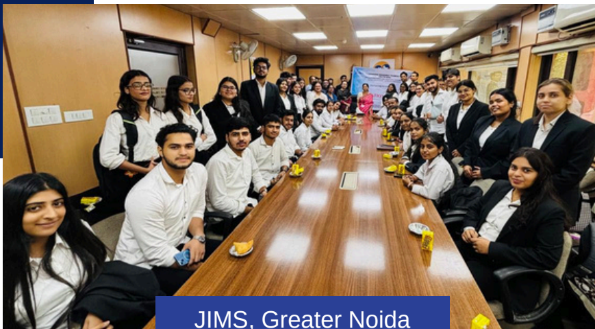
JIMS, Greater Noida